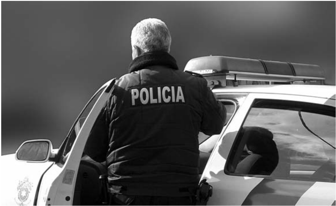
PSP de Barcelos deteve os três suspeitos do furto e apreendeu perfumes e outros artigos

Feita uma fiscalização ao veículo em que os três suspeitos se faziam transportar, a PSP apreendeu-lhes diversos artigos, entre os quais peças de vestuário